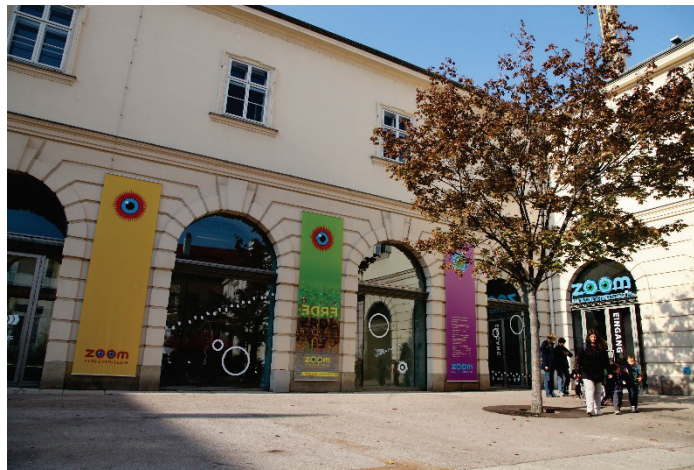
Das ZOOM Kindermuseum im Fürstentof im MQ

Die Verwendung des Bildmaterials ist ausschließlich für Presse Zwecke in direktem Zusammenhang mit dem ZOOM Kindermuseum sowie unter Angabe des Copyrights gestattet.